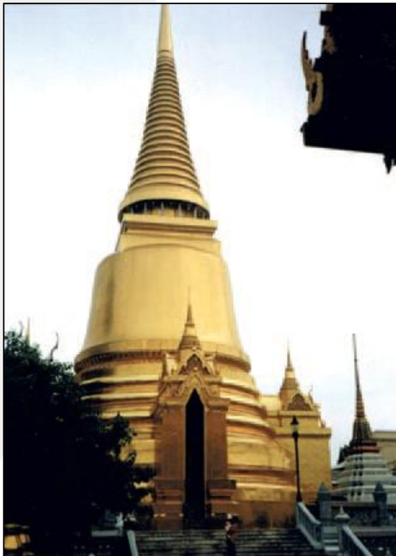
Abb. 3: Tempel in Bangkok, Thailand (Blattgold)

Vergolden mit Blattgold ist ebenfalls eine alte und bewährte Methode, um schöne und haltbare Schichten auf nichtmetallischen Unterlagen aufzubringen oder um unedle Metalle mit reinen oder hochkarätigen Goldschichten zu überziehen. Ein Goldband wird zunächst auf die Dicke von Zeitungspapier und dann vom Goldschläger mit dem Federhammer bis zu einer Schichtstärke von einem Zehntausendstel Millimeter geschlagen. Die Römer mussten sich noch mit Schichtstärken von einem Tausendstel Millimeter begnügen. Im Mittelalter wurden bereits dünnere Goldfolien von einem Dreitausendstel Millimeter erreicht, so dass man mit einem Golddukat ein Reiterstandbild vergolden konnte. Blattgold wird heute angewendet für Goldschritte bei wertvollen Büchern, Bilderrahmen, Beschriftungen auf Grabsteinen usw. In Südostasien für besonders große Flächen in Tempeln und für Buddhastatuen.