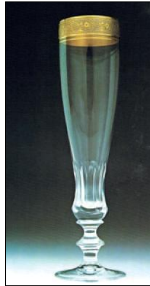
Abb. 4: Sektkelch von der Josephinenhütte, Schwäbisch Gmünd (Frankfurter Gold)

Für die Vergoldung von Porzellan, Glas und Keramik wurden um 1830 in Meißen Präparate mit gelöstem Gold verwendet. Diese hafteten aber nicht fest genug.